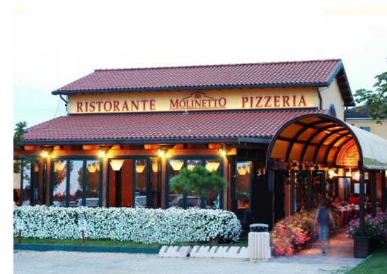
Ristorante Molinetto -Via Sx Canale Molinetto 139 Punta Marina (Ravenna) tel. 0544 430248

1° Assoluto: 350+ targa 2° Assoluto: 250 3° Assoluto: 200 4° Assoluto: 150 5° Assoluto: 130 6° Assoluto 100 1° giocatore tesserato F.S.I. Fascia elo 1700-2000 80 + targa Con elo <1700 : 40 + targa